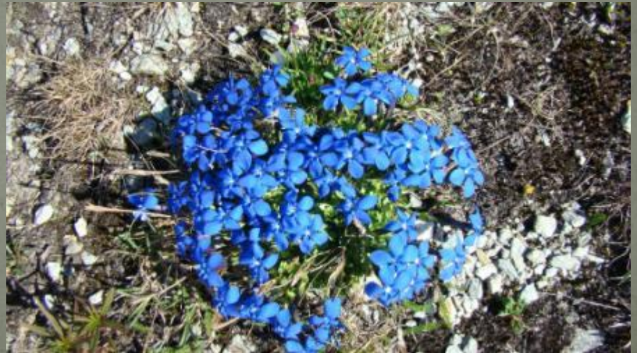
La gentiane printanière